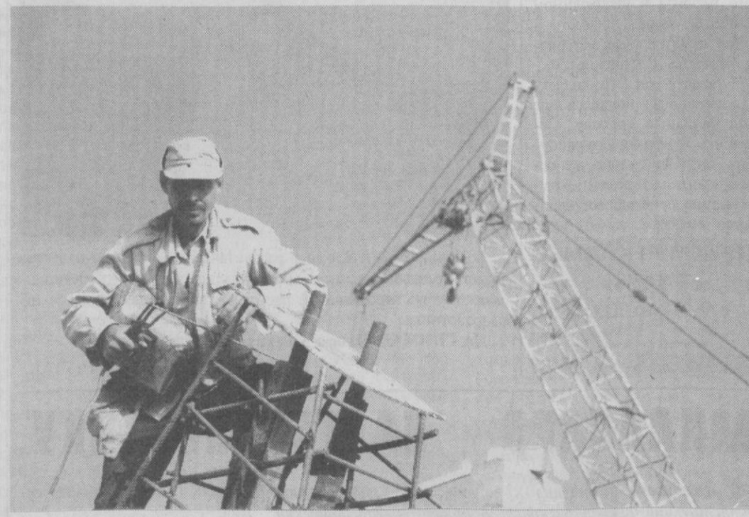
Жемчужина Востока - Самарканд готовится к большим торжествам. В скором времени здесь будут проводиться соревнования «Универсиада - 2004». В связи с этим здесь возводится ряд спортивных сооружений. Подготавливаются к соревнованиям бассейны, баскетбольные и волейбольные площадки, теннисные корты, площадки для проведения игр по мини-футболу, тяжелой атлетике, гимнастике.

По факту гибели 10 заключенных в Ираке и Афганистане начато уголовное расследование, утверждает американское армейское командование. Кроме того, следствие ведется по делу об убиении и оскорблении не менее 10 пленных иракцев. Новый начальник тюрьмы Абу Грейб объявил, что он вдвое сократит число заключенных и запретит некоторые методы ведения допросов, которые унижают человеческое достоинство.