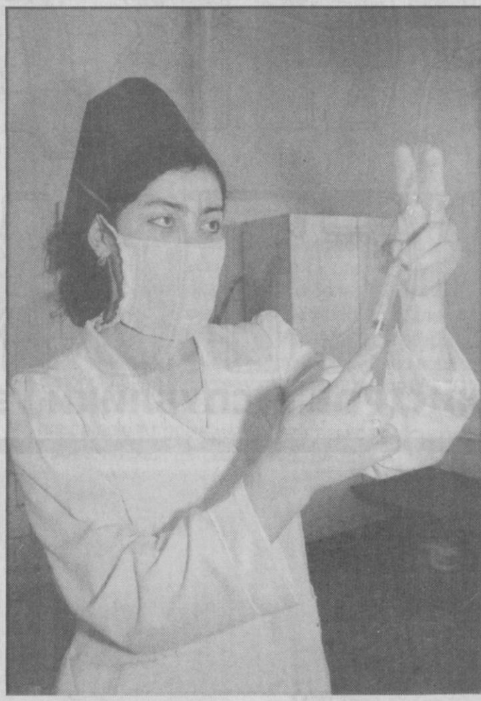
Больница № 4 г. Коканда рассчитана на 120 мест. Коллектив делает все, чтобы оказывать высококвалифицированную медицинскую помощь горожанам.

Записал Николай Барашкин. Соб.кorr. «Правды Востока». Джизак.