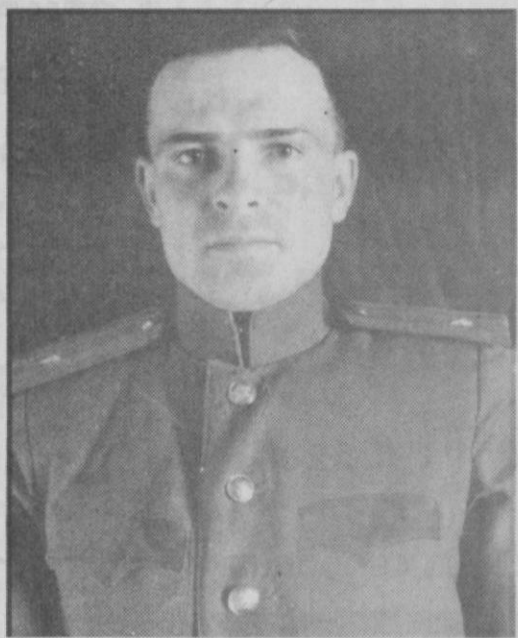
рождении первой дочери. Потом и вторая родилась.

Где двое, там и третий. Уже после разгрома фашистской Германии получили свидетельство о