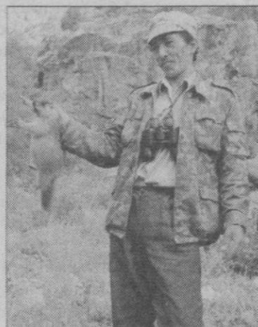
Вот такой он, красный сурок!

Красный сурок является типичным обитателем высокогорных лугов, встречаясь также в арчевых и пойменных лесах. На Кызылсуиском участке заповедника зафиксирована нижняя граница расселения вида начиная с высоты 2000 метров над уровнем моря. Он распространен в среднем и верхнем течении Кызылдарьи и ее притоков. Средняя плотность населения красного