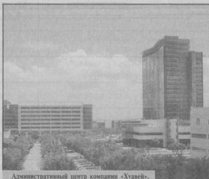
Административный центр компании «Хуawei». Окончание. Начало в № 104-105; 110.

Условия успеха в этой зоне реформ - хороший инвестиционный климат, четкая правовая база, надежная защита капиталов, развитые коммуникации. «В районе Пудун сосредоточена мудрость всего мира», - такое мнение высказал один из представителей местной власти, рассказывая нам о том, что в строительстве различных объектов здесь участвуют архитекторы Японии, Франции,