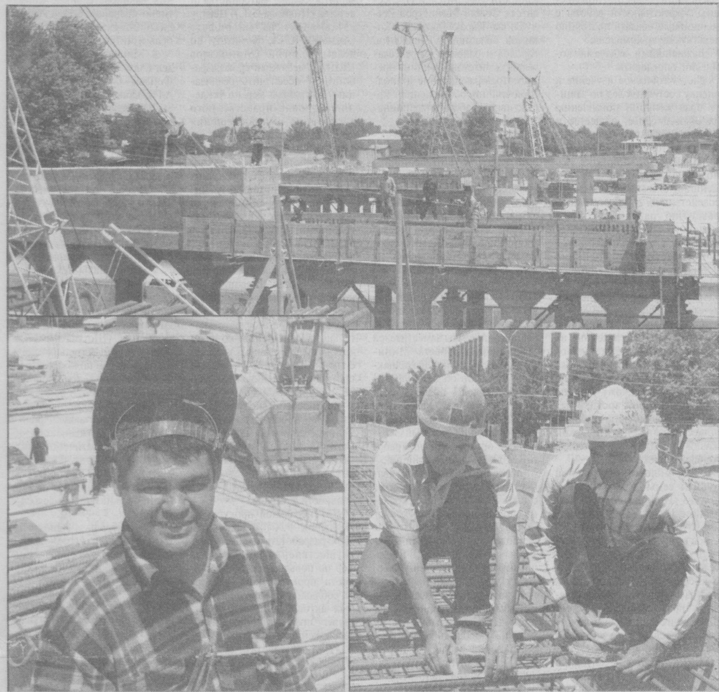
В Ташкенте продолжается строительство моста на пересечении улиц Амира Темура и Софийской. Длина моста составит 1 км, ширина - 28 метров. Работают здесь три мостоотряда - два ташкентских и