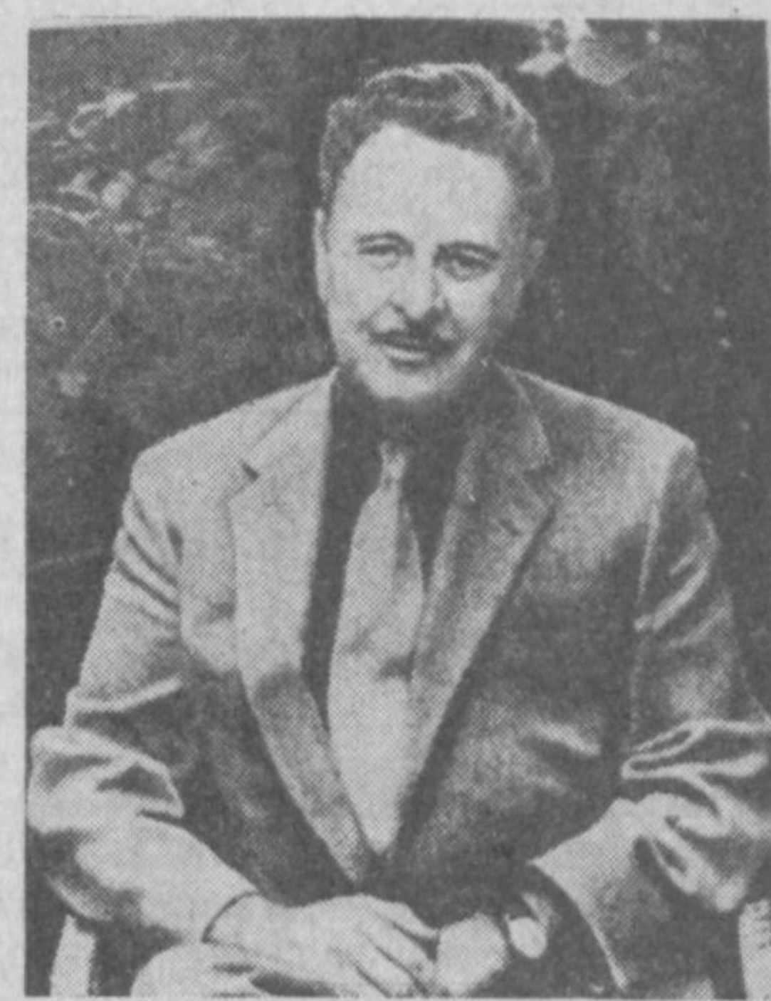
Юқори кўтариб, сиз билан бизни оғушига орлаб турибди. Тилвк ЖҶРА