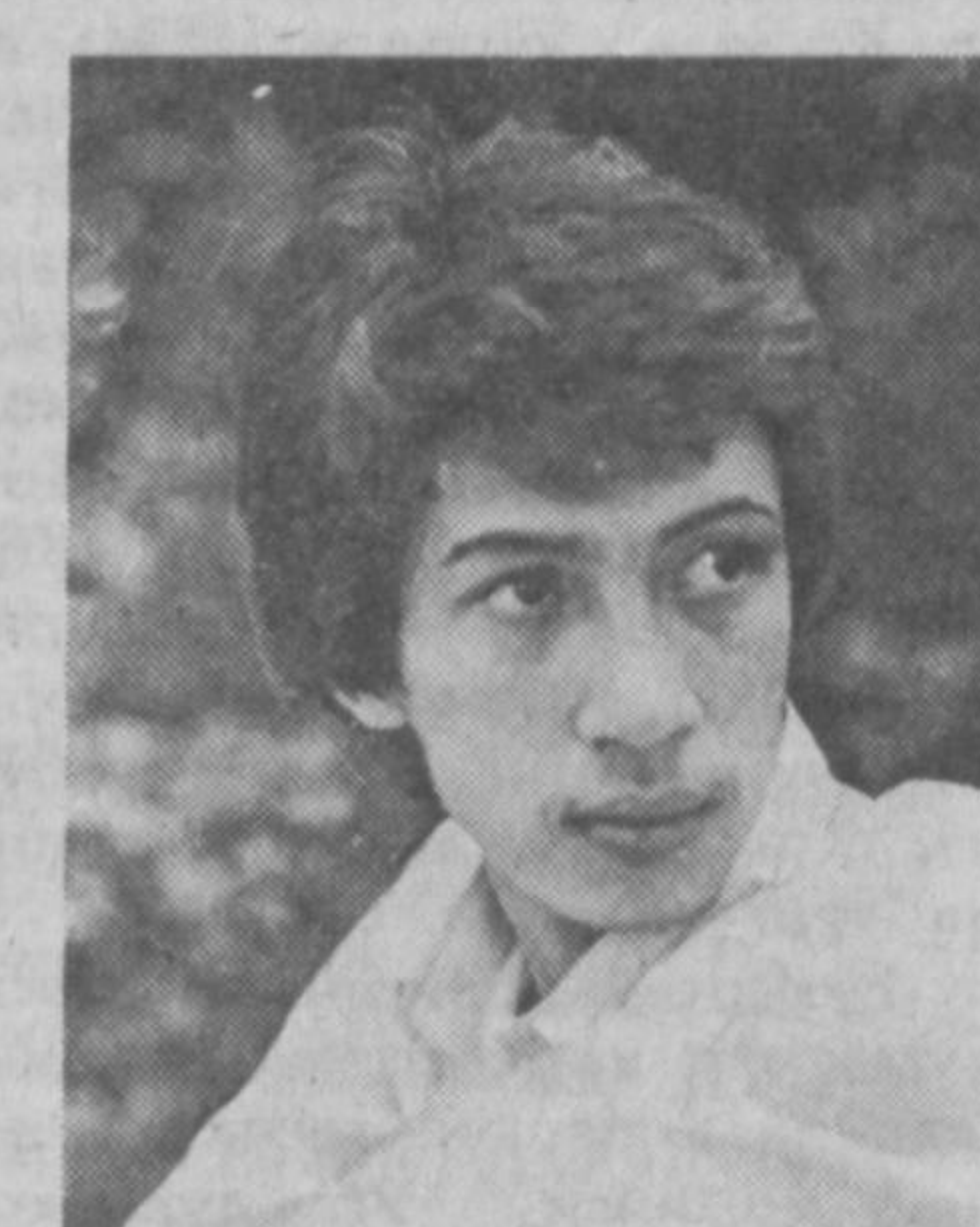
Адабиётнинг абадул-абад мавзуси — инсон. Унинг ҳаёти, тақдирини, таъбири, қувонч, ғолиб ва мағлублигидан тортиб қалибдаги ноиятлар, ҳис-туғилуларига — ҳаммаси адабиётнинг ўткир нигоҳида...