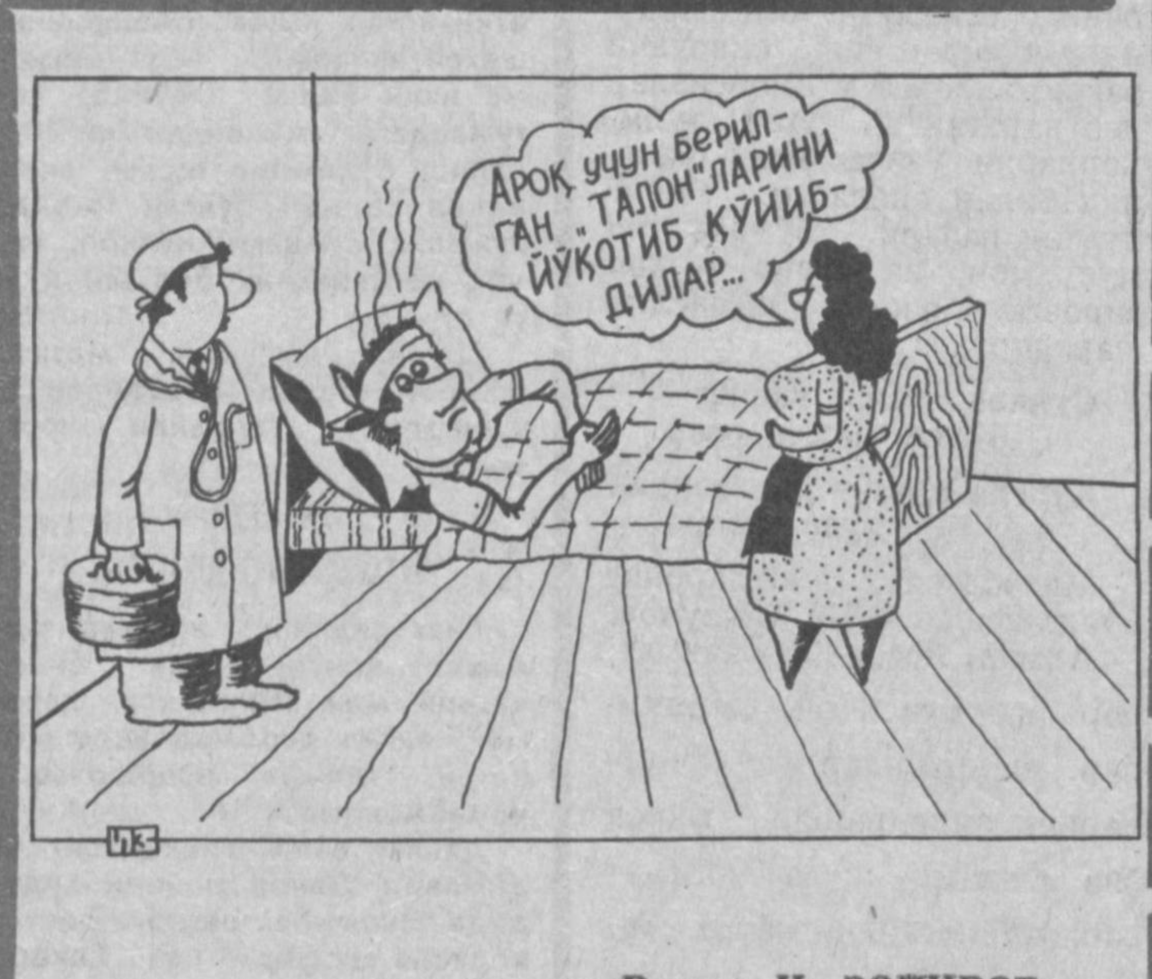
Рассом И. ЗОГИРОВ

Одамлару одамлар, эшитмадим деманглари! Қашшоқ хўжа жамоа хўжалиги бозор иқтисодиётига ўтилиши муносабати билан давлат