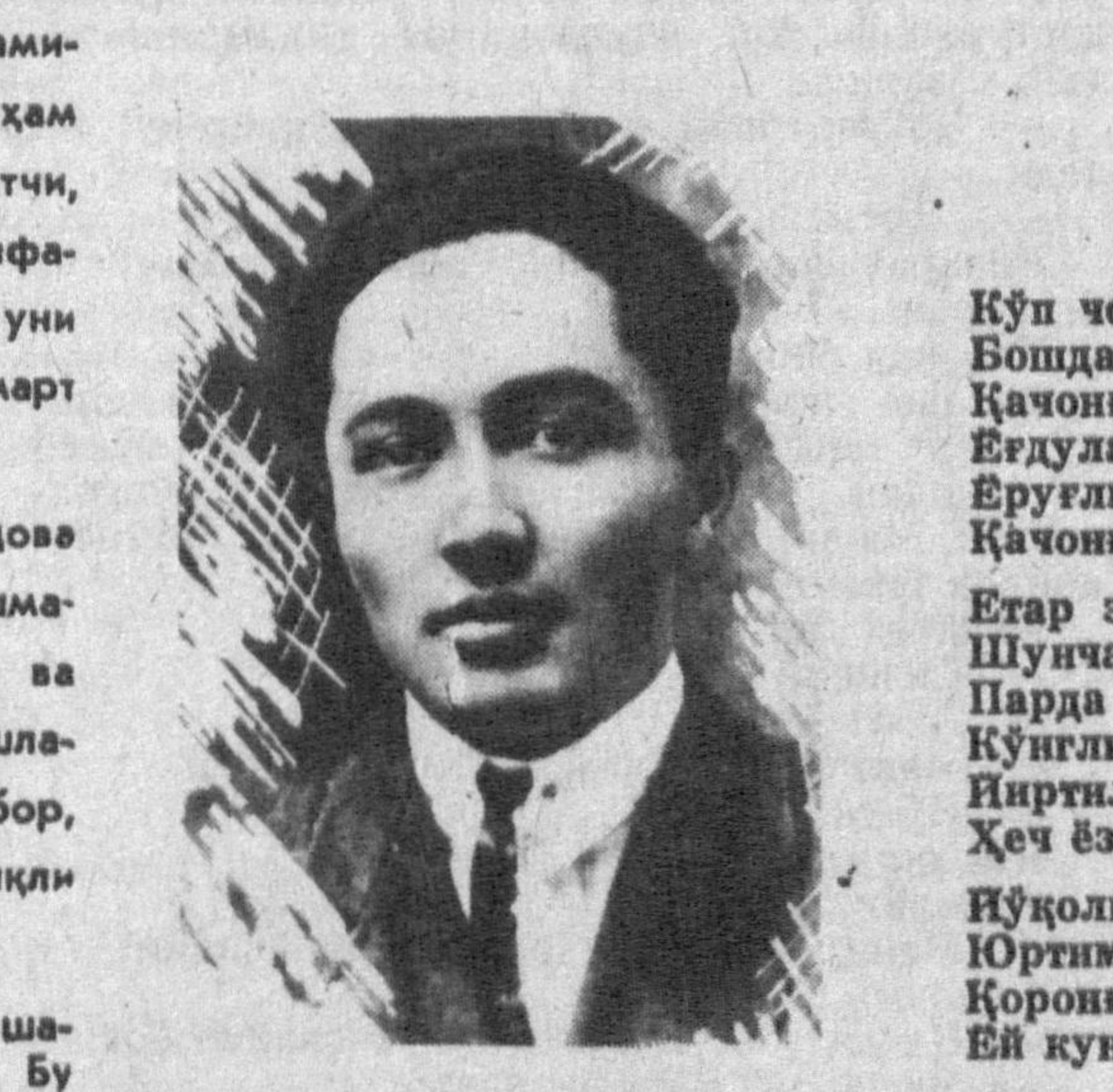
Фитрат, Чўлпон, Боту ва Элбек шеърларини ўз ичига олган эди. Тўплама Ботунинг «Ке-нинг», «Етар эмди...», «Муз кунда», «Хижрон тўлиқини» каби ўнла шеъри кирган.