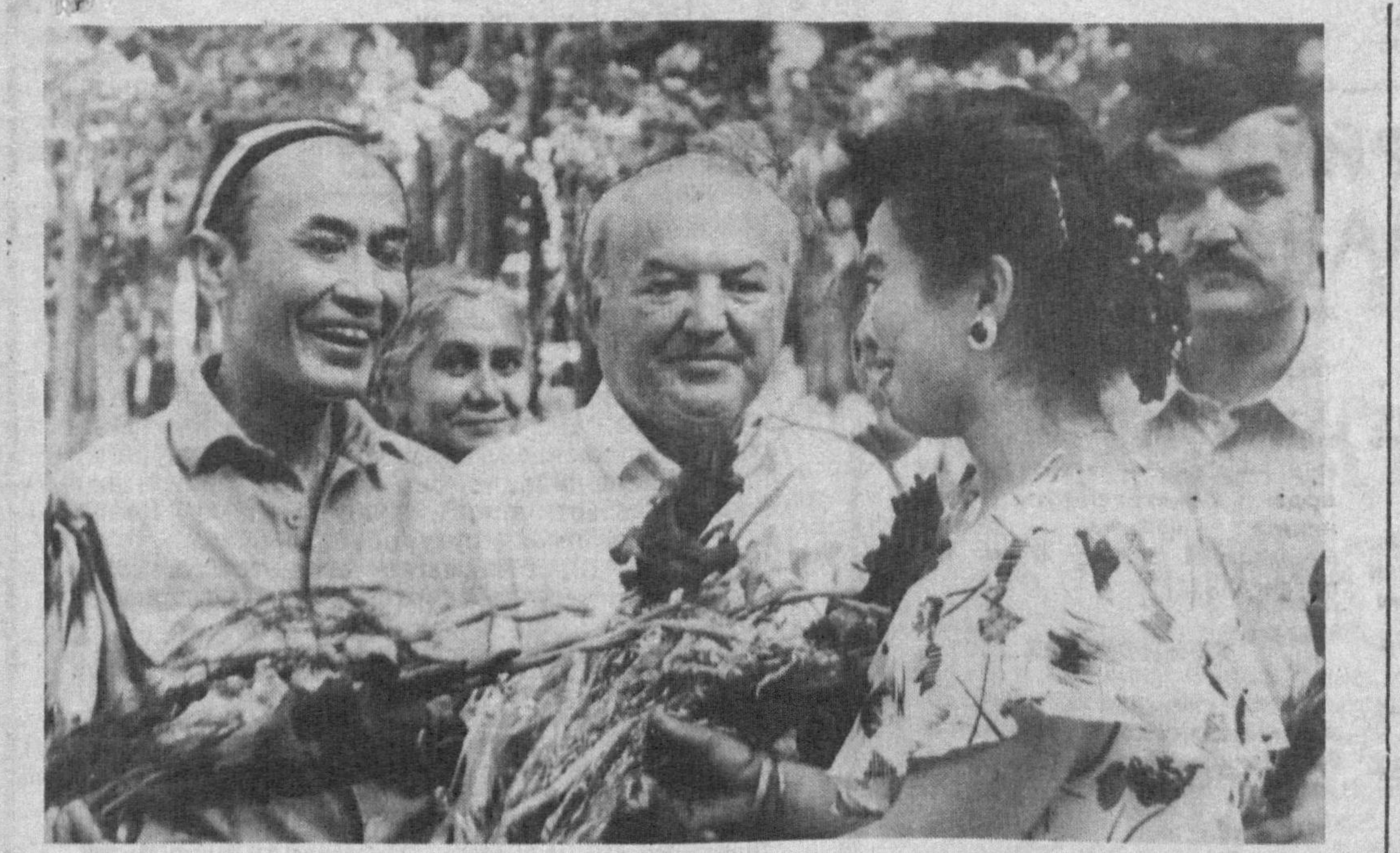
Кунин кеча Паркент туманининг «Кўшчинор» боғида Мирзо Улуғбек таваллудининг 600 йиллигига бағишланган катта тадбир бўлиб ўтди.

Ориф Усмоновнинг монография, тўплам, рисола ва мажмуалари Тошкент, Кобул, Душанба, Париж, Висбаден (Олмон) шаҳарларида нашр қилинди.