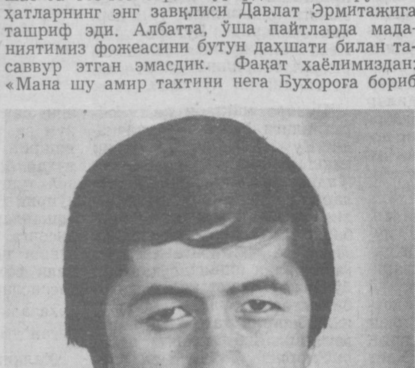
Карим БАХРИЕВ, Ўзбекистон Республикаси Олий Кенгаши аъзоси