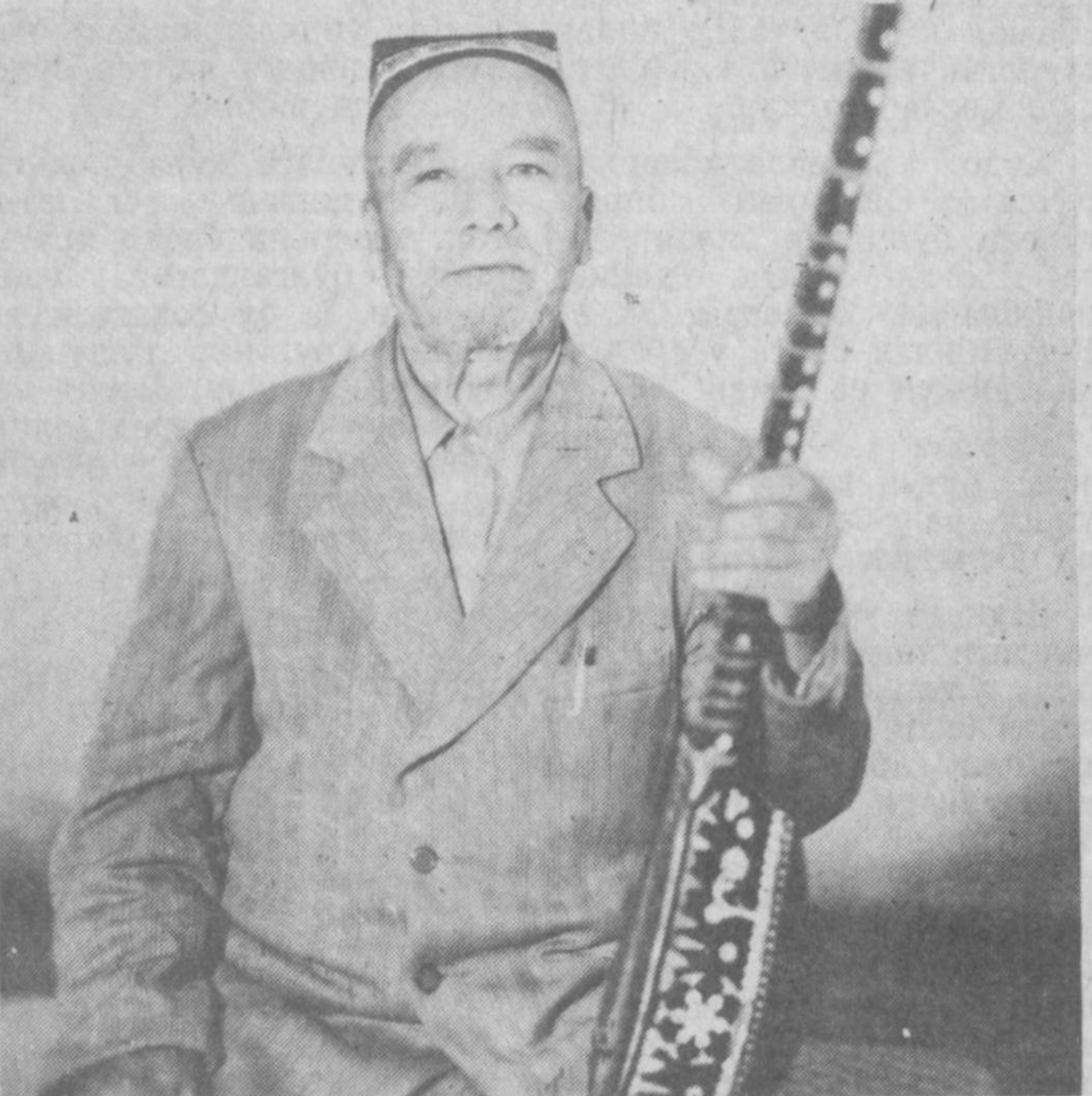
На қилдим санга ман ёрим, жамолнидан жудо қялдинг, Бошига гарди ғамин чуи чароғи осий қялдинг.