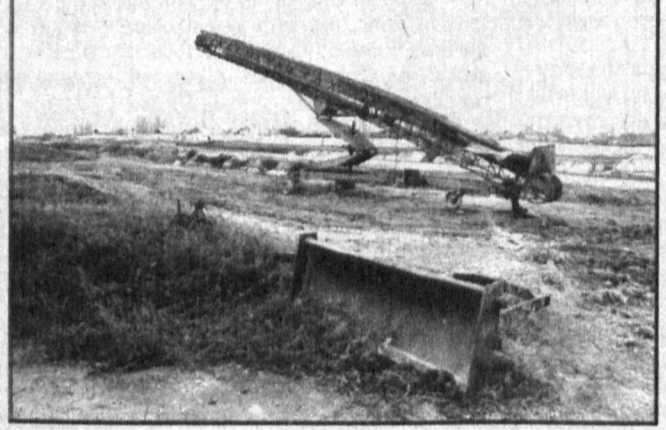
В последнее время на животноводческих фермах Бозского района значительно снизился надой молока, уменьшилось поголовье скота. Это результат низкой производительности труда и халатного отношения к своим обязанностям.

Обособно тяжелое положение создается в общественных хозяйствах имени Юсуфжана Шадманова, Маннаба Жалалова, "Янги турмуш" и ширкатом хозяйстве "Озод". Техника на животноводческих фермах этих хозяйств стоит без ремонта, не хватает кормов. Словом, проблем на животноводческих фермах района очень много, но никто не решает их. Так, например, в хозяйстве имени Юсуфжана Шадманова в прошлом году было 44 коровы, а в этом году значительно уменьшилось. Резко снизился надой молока. Если в прошлом году от каждой коровы надаивали по 243 литра молока, то нынче лишь по 200 литров. Не лучше положение и в хозяйстве имени Маннаба Жалалова. Техника, на приобретение которой было истратено немало денег, валяется. На самотек пушены дела и в общественном хозяйстве "Янги турмуш". В коровниках грязь, не лучше положение и в ширкатом хозяйстве "Озод". Удивляет беспечность руководителей и работников ферм. Какие же меры думают принять руководители района для устранения недостатков?