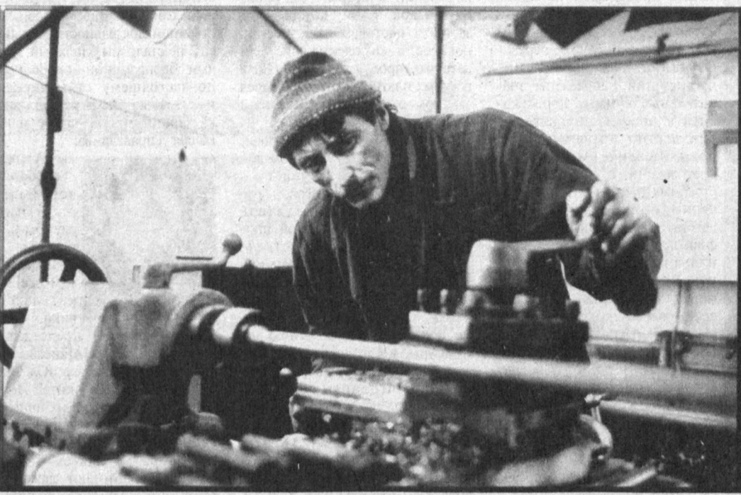
В эти дни коллектив Пахтакорского механического завода Джизакской области ведет качественный ремонт сельхозмашиностроительной техники. Трудятся здесь 80 человек. Рабочие предприятия совместно с рационализаторами из Ташкента предложили новые виды частей для гребневой посевной техники. В минувшем году здесь чистая прибыль составила 9 млн. 850 тыс. сумов. В последнее время на предприятии значительно улучшилось качество производимой продукции, поэтому и спрос у дехкан на продукцию растет.