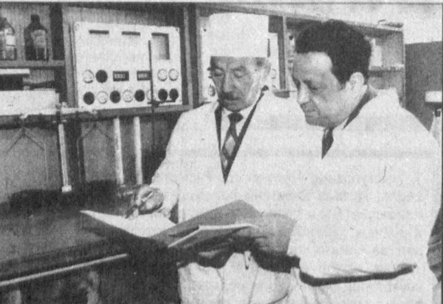
Известной немецкой фирмой «Байер», которая поставит четыре формулирующих и фасующих таблетки оборудования.

Хочу упомянуть, что не только нервы и наследственность могут спровоцировать болезнь, но, по моим наблюдениям, и ненормальное пищеварение предрасполагает к этой болезни. Так что родители должны всегда следить за нормальной жизнедеятельностью организма ребенка. Тем более, что лечение их осложнено определенными трудностями.