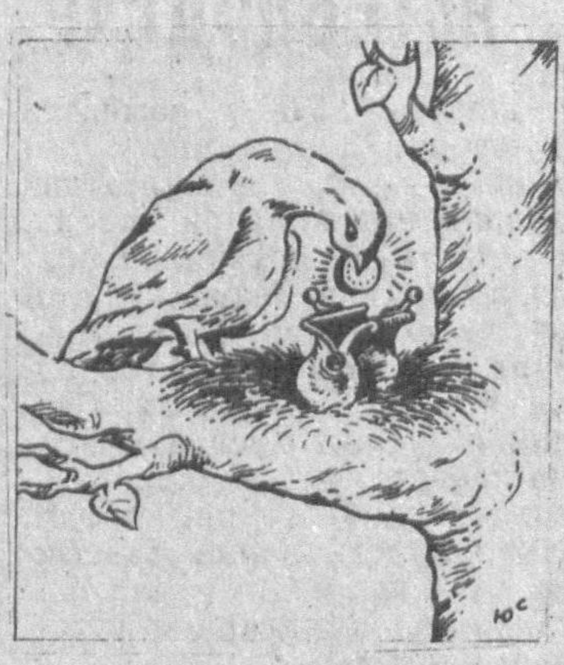
Рассом Юсуф ШОКИРОВ