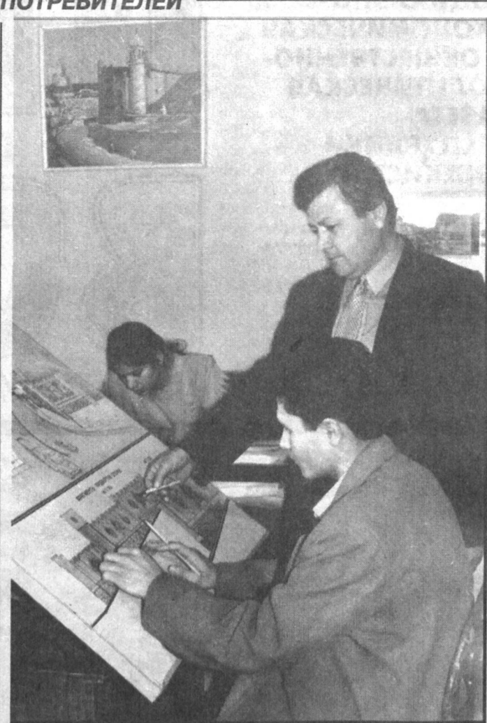
Тракт Ташкент-Бухара проходит через Самаркандскую область, расстояние это составляет 350 километров. Сейчас вдоль этого тракта по проекту объединения "Самавтойд" ведется интенсивное строительство автотехобслуживания, заправочной, мини-рынков. 50 зданий, которые создадут удобства пассажирам, будут сданы в эксплуатацию накануне Науруза. В строительстве этих объектов принимают активное участие частные предприниматели, банки "Парвина" и "Умар", предприятия нефтепродуктов, хозкимпети районов. До конца года вдоль этого тракта будет построено около 800 различных объектов.