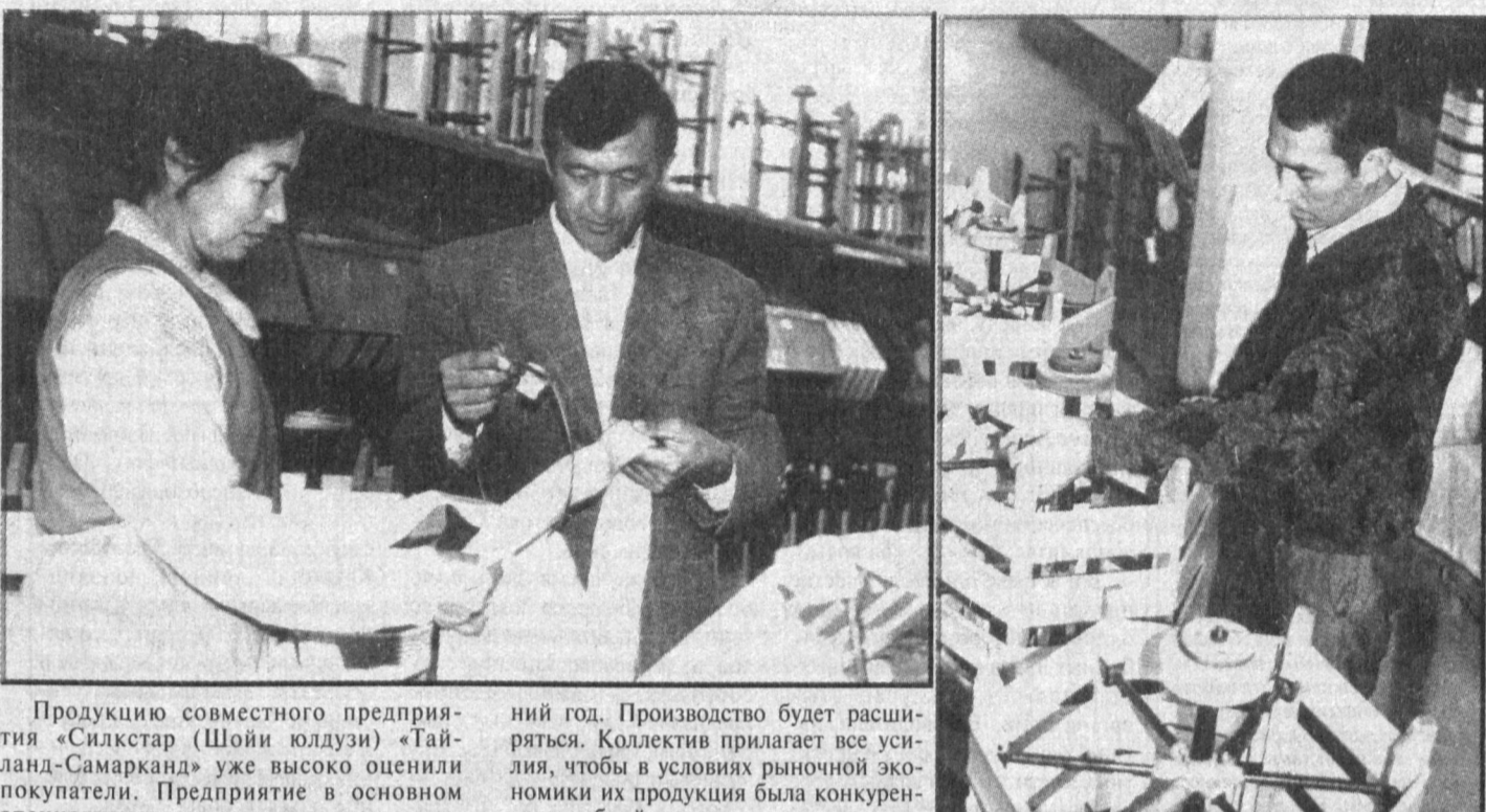
Акрамов; механик Бахриддин Худойбердиев.