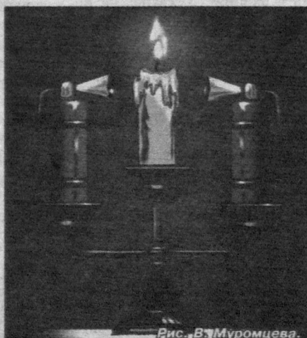
Рис. В. Муромцева.