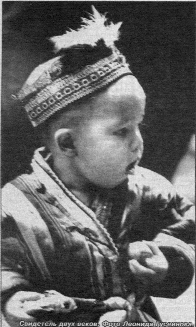
Свидетель двух веков.