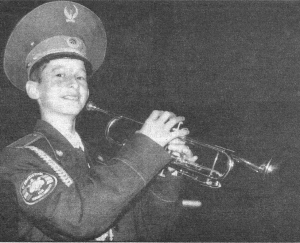
Маленький трубач.