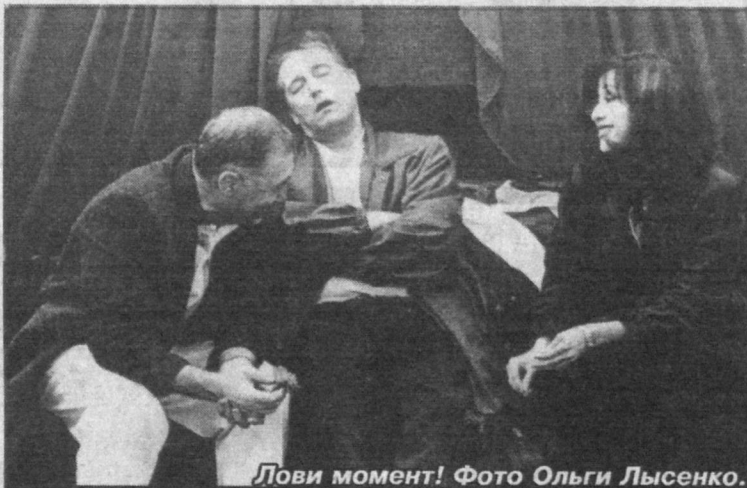
Лови момент!