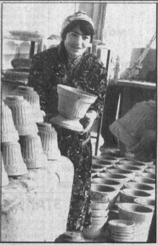
Более двадцати лет работает художественное гончарное объединение «Ешлик» в городе Китабе. Недавно коллектив объединения начал изготавливать национальные гончарные изделия, статуэтки, игрушки более 10 видов.

В минувшем году чистая прибыль предприятия составила более полмиллиона сумов. Сейчас коллектив объединения готовится к открытию совместного предприятия в сотрудничестве с Украиной по розливу минеральной воды.