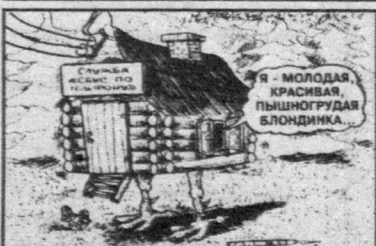
Рис. А. Маркелова.