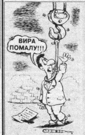
Рис. Александра Маркелова.

- Чем могу еще служить, сэр? - спрашивает лакей, стараясь угодить даме и господину, только что занявшим комнату в гостинице. - Нет, спасибо, ничего не нужно, - отвечает джентльмен. - Может быть, что-нибудь нужно вашей супруге? - Хорошо, что напомнили! Принесите почтовую открытку. ***