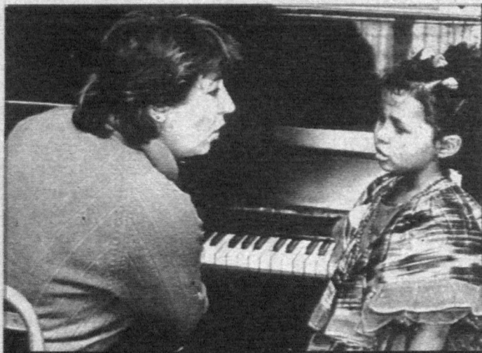
Святая к музыке любовь