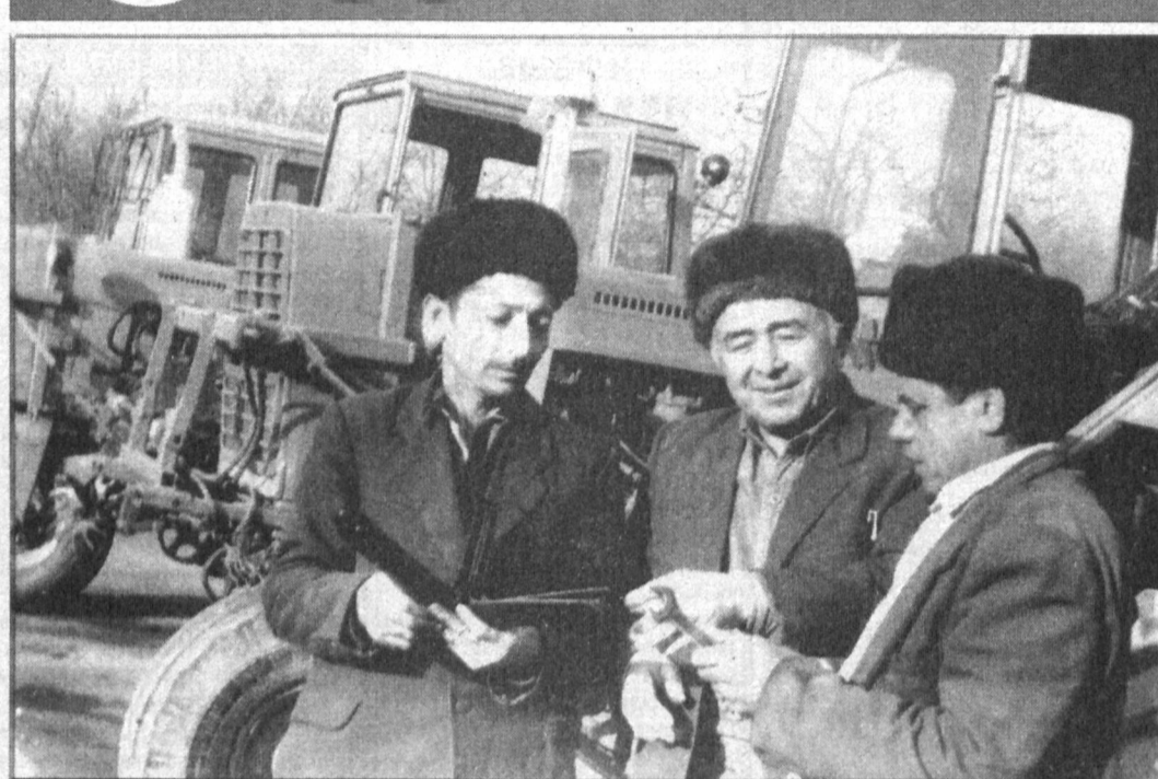
Ремонтники ширкатного хозяйства «Ижодор» Наманганского района готовятся к весенней посевной. Уже 20 января полностью были отремонтированы 20 пропашных тракторов, 19 транспортных, 14 сенокос, из них четыре для севы хлопчатника под пленкой, 4 чизеля, планировочные агрегаты.