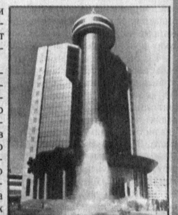
осмотрел Шайхантахурский академический лицей при Университете мировой экономики и дипломатии.

Президент Ислам Каримов 20 марта ознакомился с несколькими такими праздничными сооружениями.