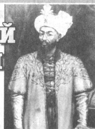
«Улугбек протянул руку к наукам и добился многого. Перед его глазами небо стало близким...»

Столицей огромной империи великого Амира Темура был Самарканд. Большой и богатый город был тесно связан торговлей по Великому шелковому пути с Китаем, Индией, Ираном, арабскими странами, с Русью и Европой. При Темуре и его любимом внуке Улугбеке (от сына Шахруха) получили развитие архитектура, поэзия, наука, богатые города.