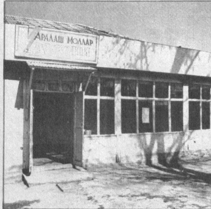
С прискорбным положением дел вы столкнетесь, посетив магазины, относящиеся к торгово-производственному объединению «Назармахрам», что расположено в Шахриханском районе Андижанской области.

Тимур Низаев. Обозреватель «Правды Востока».