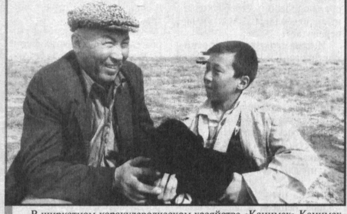
В ширкатном каракулеводческом хозяйстве «Канимек» Канимекского района Новойской области успешно начался охотный сезон. Животноводы хозяйства взяли на себя обязательства из каждой сотни овцематок получить 105 агнят при общей численности племени в 22,5 тысячи голов.

здесь намечено вырастить кукурузу на площади в 3 тысячи гектаров. Юрий Гентшке. Соб. корр. "Правды Востока". Ферганская область. Чори Тухтаев. Корр. УзА.