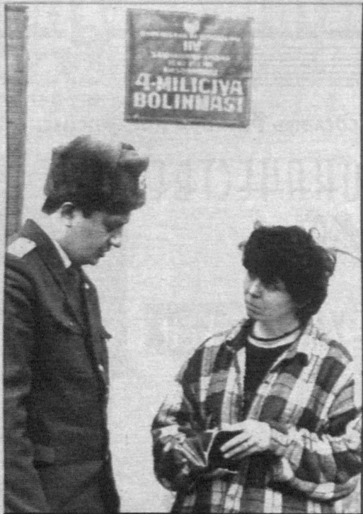
Фото Тохира Норкулова (УзА). Самаркандская область.

В последнее время в судах резко увеличилось количество рассматриваемых уголовных дел, связанных с подделкой документов. Сейчас при наличии компьютерной и множительной техники легко изготовить любой документ, и порой приходится обращаться к различным экспертам, чтобы отличить его от настоящего.