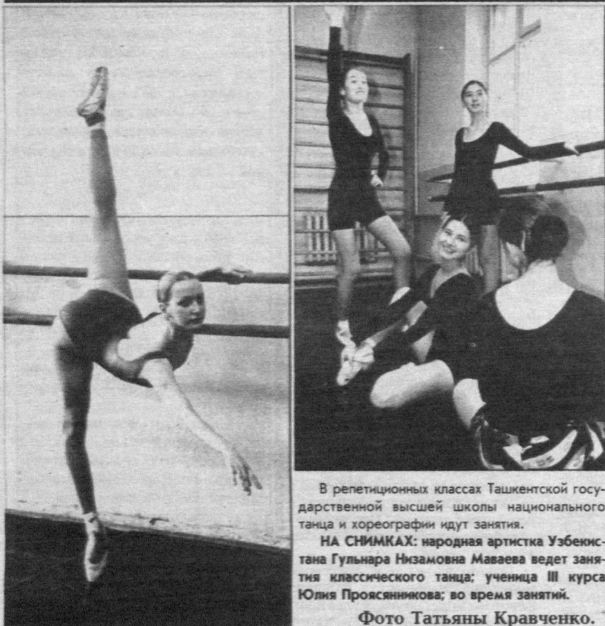
В репетиционных классах Ташкентской государственной высшей школы национального танца и хореографии идут занятия.