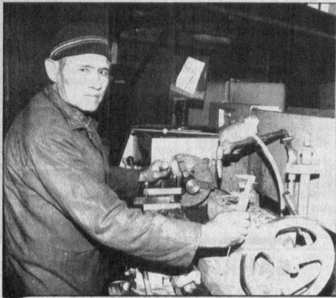
Завод "Иригдомаш" Министерства сельского и водного хозяйства Республики Узбекистан, что расположено в Бектемирском районе столицы, - один из передовых хозяйств страны. В этом году ему исполнилось 20 лет.

Неудивительно и то, с какой осторожностью относится жители 16-го квартала к речам чиновников по поводу товариществ собственников жилья. К примеру, товарищества определяются как "объединение", а значит, квартироладельцы лишаются прав собственности на передаваемый туда весь дом вне своей квартиры. Одно дело - иметь что-то в своей собственности и совсем другое - обладать долей в имуществе организации.