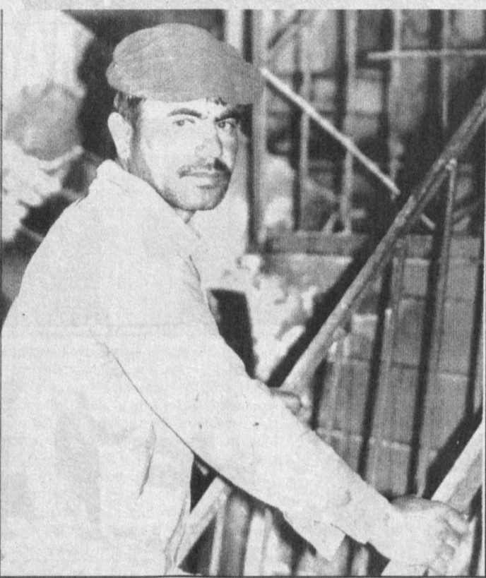
АО «Хужайкон» по выработке соли, что в Шерабадском районе, единственное подобное предприятие в республике. В нынешнем году ему исполняется 20 лет. За эти годы коллектив произвел более 5 миллионов тонн технической и 450 тысяч тонн пищевой соли.