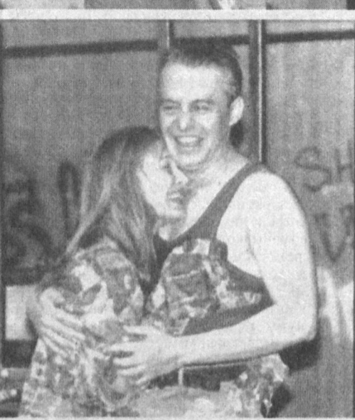
Быть может, надо остановиться, оглянуться...