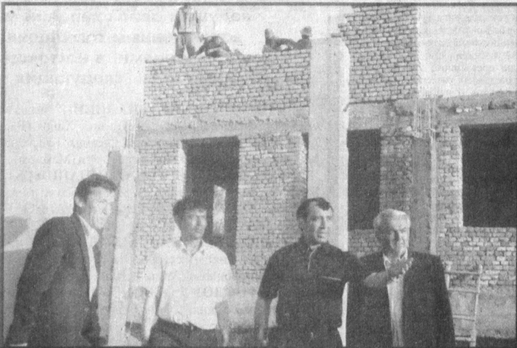
ГОД ЗДОРОВОГО ПОКОЛЕНИЯ