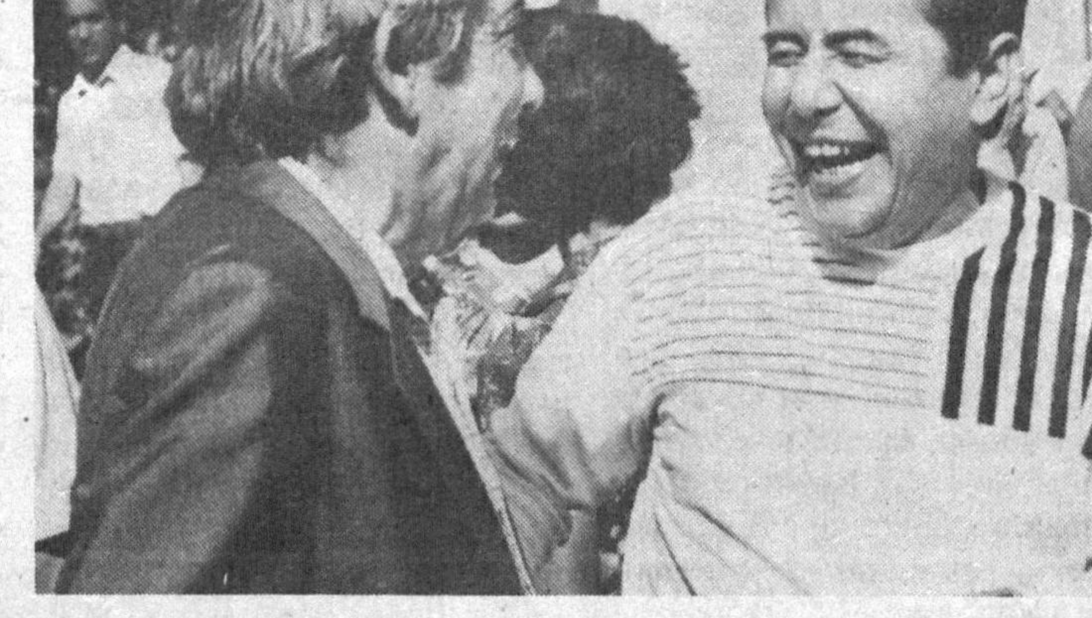
Сайд АҲМАД, Ўзбекистон халқ ёзувчиси

«Ўзбек иши» деган гапни ким ўйлаб толди? Нима учун «Рус иши», «Арман иши», «Молдаван иши» эмас-да, айнан «Ўзбек иши»? Ўзбек нима ёмонлик қилди? Қўшиб ёзишлар бошқа жойда йўқми? «Ўзбек иши» туйғайди армиядаги қанчадан-қанча йигитларимиз нобуд бўляпти. Темир тобултур фақат Афғонистонда эмас, Совет Иттифоқининг турли чеккаларидан ҳам қўлаб келиб турибди. Бизнинг фарзандларимизга «босмачи», «қўшиб ёзувчи», «порахур» деб қарашапти ва очикдан-очик улдиришапти. «Ўзбек иши» деган ҳақоратли гапни ўйлаб топганлар хали тарих олдига жавоб берадилар.