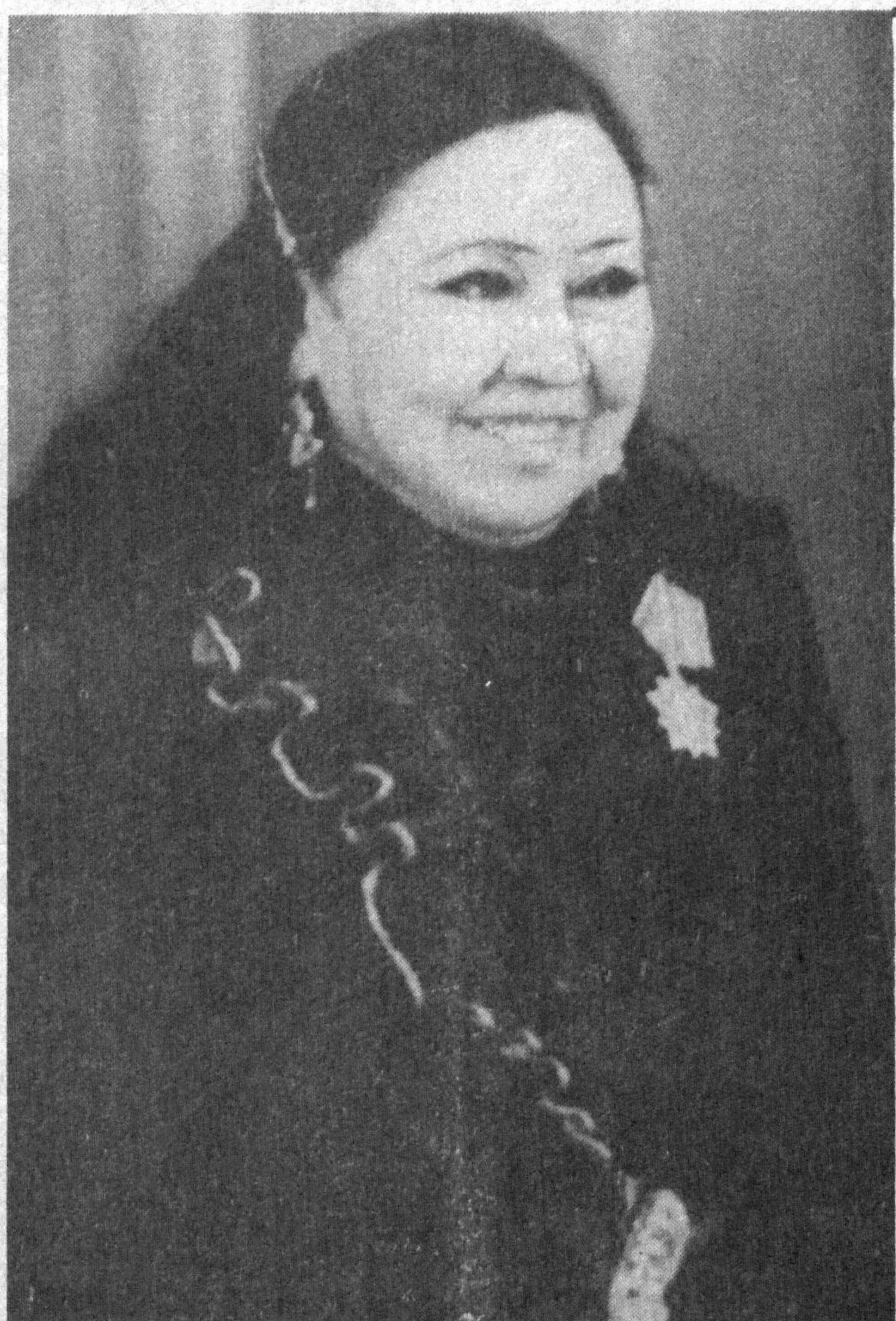
Халқ артисти Ҳалима НОСИРОВА