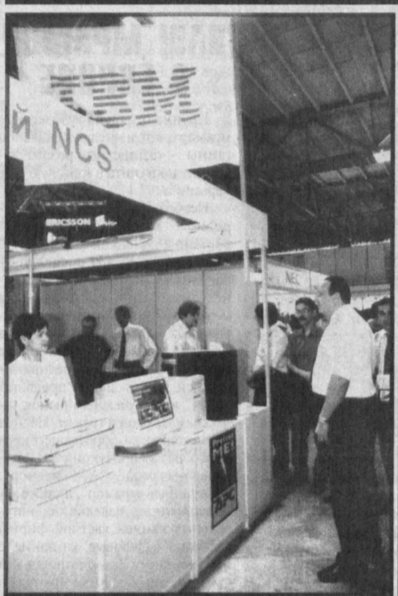
В рамках состоявшейся в Ташкенте выставки UzTel-2000 группа компаний NCS продемонстрировала свои разработки, применимые при создании корпоративной информационной сети, для организации, структурные подразделения которых расположены по всей территории Республики Узбекистан. Для безотказной работы компьютеров в информационной сети предполагается использовать серверы и компьютеры всемирно известного производителя IBM и сетевое оборудование компании Cisco System.