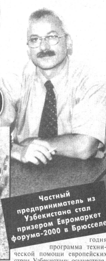
Частный предприниматель из Узбекистана стал призером Евромаркет форума-2000 в Брюсселе.

Импозантный, с коротким ежиком седых волос, человек горделиво по-казывает свои «трофеи» - небольшие блестящие сооружения из двенадцати звезд (по количеству стран Евросоюза) с логотипом Европейского центра по исследованию рынка посредника.