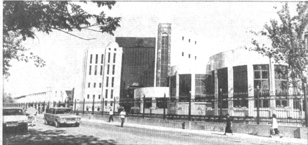
По городам страны. Новое здание Центрального банка в Нукусе; главная площадь в Берути.