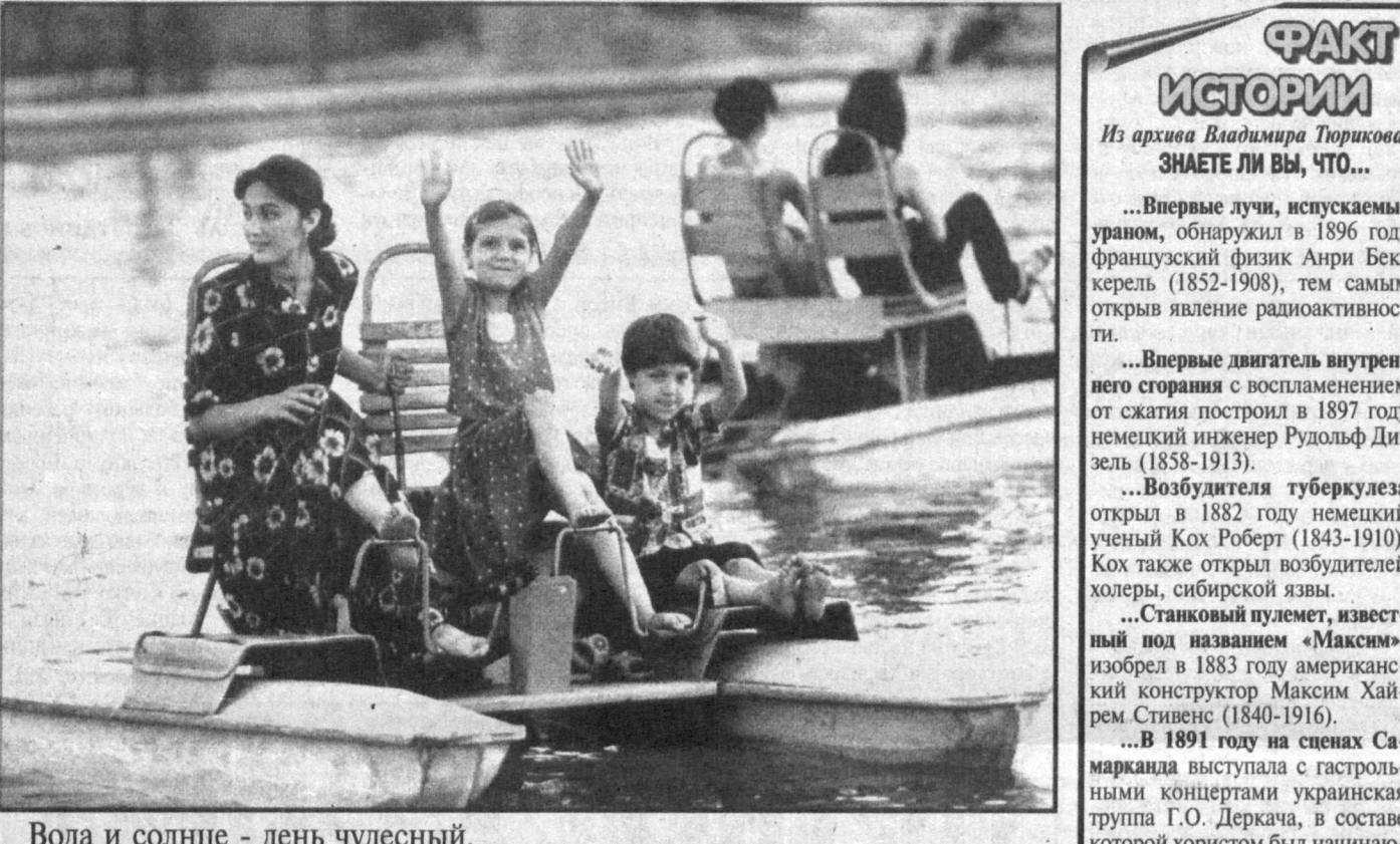
Вода и солнце - день чудесный.