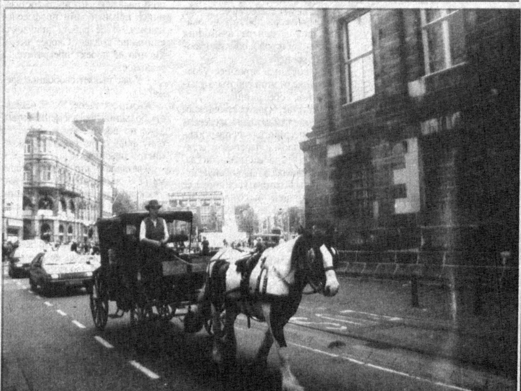
На улицах голландского города Мастрихт часто можно встретить старинные фаэтоны.