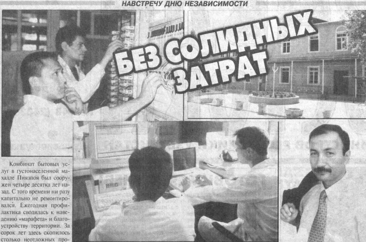
Комбинат бытовых услуг в густонаселенной махалле Пиэзпой был сооружен четыре десятилетия назад. С того времени ни разу капитально не ремонтировался. Ежегодная профилактика сводилась к наведению «маршета» и благоустройству территории. За сорок лет здесь скопилось столько неотложных проблем, что без капитальной реконструкции нельзя было обойтись.

В частности, ведущее значение в подготовке банковских кадров имеют созданные 40 специализированных банковских классов, пять банковских колледжей и банковско-финансовая академия. Созданные в структуре Ассоциации страховая, линговая, проектно-инжиниринговая, рейтинговая, инвестиционно-трастовая и другие компании, а также компания по внедрению общепанельных пластиковых карточек служат созданию современной финансовой инфраструктуры банковской системы.