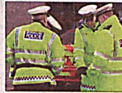
Беш киши қўлга олинди

«Катта йигирмалик» саммити бошланишига бир неча кун қолганда Британия полицияси ушбу тадбирни барбод қилишга тайёргарлик кўраётган беш кишини қўлга олди. «The Times» хабар беришича, улардан қурол макетлари ва қўлбола портлаш мосламалари олинган. Уларнинг барчаси – шу жумладан 16 ёшли ўсмир ва икки нафар 20 ёшли қизлар – Плимут шаҳри ҳудудида қўлга олинган.