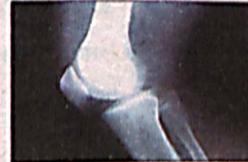
Тизза рентгени бармоқлар изидан ишончлироқ

Серия терактов и диверсий произошла в Белфасте (Северная Ирландия), передает телеканал «Вести-24». Власти подозревают боевиков, связанных с Ирландской республиканской армией, сообщает Интерфакс. По данным СМИ, за вечер они угнали сразу несколько десятков машин – с оружием в руках останавливали водителей на перекрестках, затем отгоняли автомобили в центральную часть города – и поджигали. Движение на центральных улицах города оказалось парализовано.