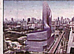
Бангкокда «айланувчи» осмонўпар бино курилади

Сотни человек считаются пропавшими без вести после того, как судно с 365 нелегальными эмигрантами на борту, предположительно направлявшееся в Италию, затонуло у берегов Ливии. Это второй подобный инцидент, передает РИА Новости со ссылкой на ливийские власти. По данным Reuters, ливийской береговой охране удалось спасти только 23 человека. Остальные 342 пассажира считаются пропавшими без вести.