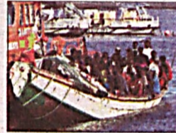
У берагов Ливии затонуло судно с мигрантами

«Катта йигирмалик» саммити бошланишига бир неча кун қолганда Британия полицияси ушбу тадбирни барбод қилишга тайёргарлик кўраётган беш кишини қўлга олди. «The Times» хабар беришича, улардан қурол макетлари ва қўлбола портлаш мосламалари олинган. Уларнинг барчаси – шу жумладан 16 ёшли ўсмир ва икки нафар 20 ёшли қизлар – Плимут шаҳри ҳудудида қўлга олинган.