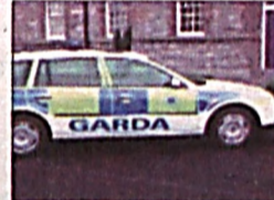
Серия терактов и диверсий произошла в Белфасте

Отель ва савдо марказига эга бўлган, 14 гектар майдонни эгаллайдиган «айланувчи» осмонўпар бино Бангкок (Таиланд) марказида курилиши кўзда тутилмоқда, деб хабар беради РИА Новости ахборот агентлиги. Бино икки қисмдан иборат бўлади: пастки қисми 7 қаватли ўзига хос подиум бўлиб, ундан оқорига томон оҳиста айланувчи 30 қаватли иккинчи қисм курилади ва унинг таркибида олти юлдузли отелль бўлади. Бино лойиҳасини Аманда Ливитнинг архитектура устахонаси ишлаб чиққан.