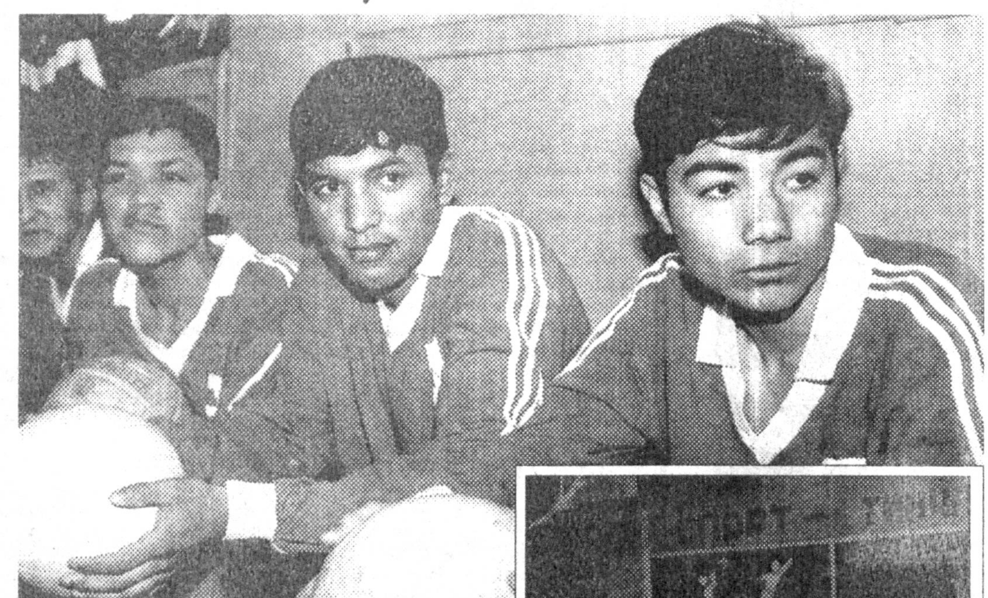
“Камолот” жамғармаси Тошкент шаҳар бўлими ёшлар ўртасида жисмоний тарбия ва спортга бўлган қизиқишни ошириш йўлида мунтазам тадбирлар ўтказиб келади. Кўни кеча Собир Раҳимов туманидаги 242-ўрта мактабда навбатдаги тадбирлардан бири -- “Камолот” кубоги мусобақалари ўтказилди. Унда пойтахтимиздаги барча туманлар спорт жамоалари ўзаро куч синашди.

Ички ишлар вазирилик тизимида беллашувлар икки йўналишда ўтади. Биринчи йўналишда туман ички ишлар бўлими ҳодимларидан иборат туман жамоалари ташкил этилади.