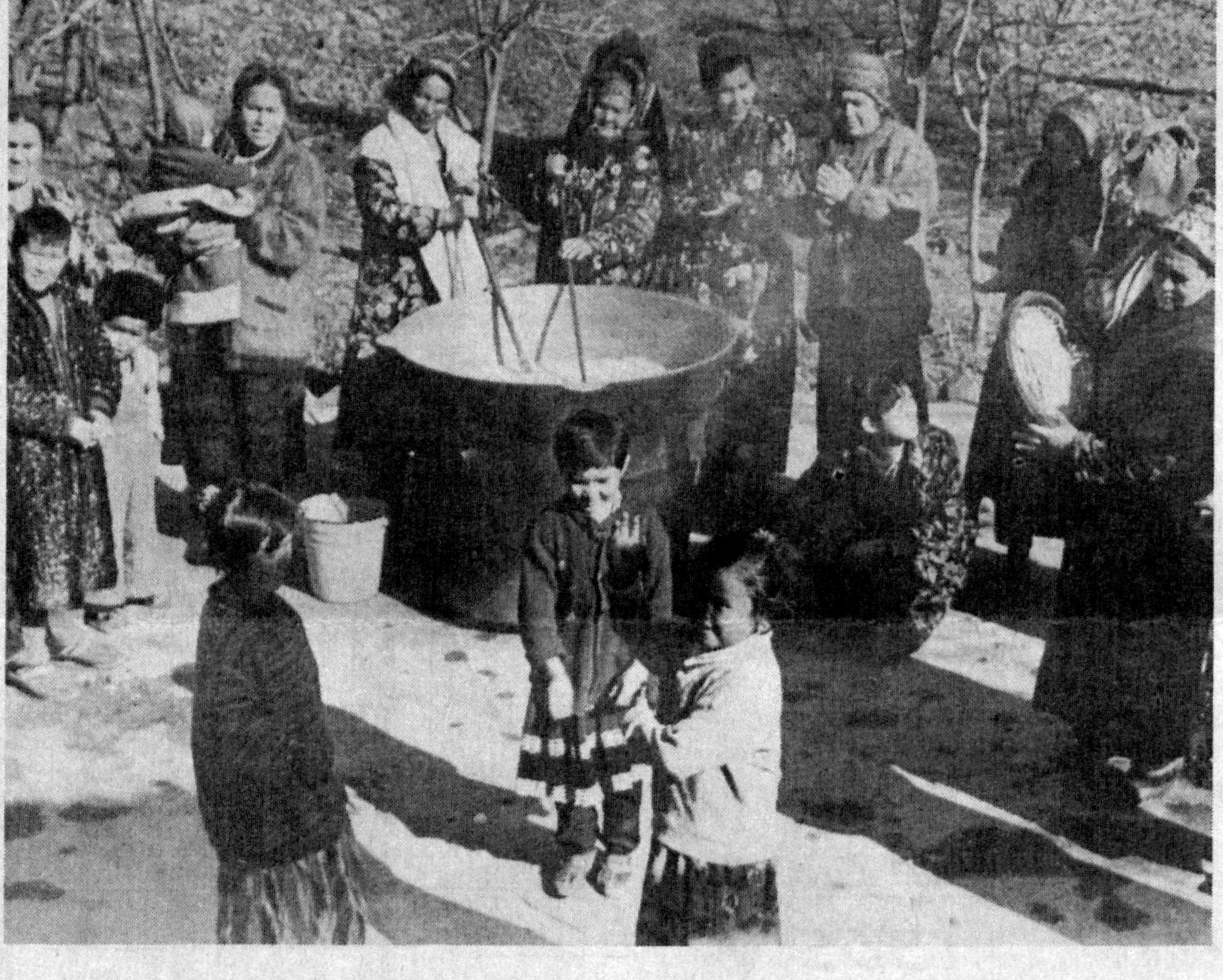
Мамлакатимизда Наврўз тантаналари бошланиб кетди. Суратда: Сурхондарё вилоятининг Ангор тумани марказида Наврўз шодиёналари.

Б М Т. Бирлашган Миллатлар Ташкилоти Бош қотиби Кофи Аннан билан АҚШ Президенти Бил Клинтон ўртасида бўлиб ўтган музокаралар асосий эътибор Ироқ музокарасига қаратилди. Б.Клинтон БМТ билан Ироқ ҳукумати ўртасидаги ахлшлуви ижобий баҳолаб, ҳозир Ироқдаги шубҳали объектиларни текшириш ишлари яхши бораётганини таъкидлади.