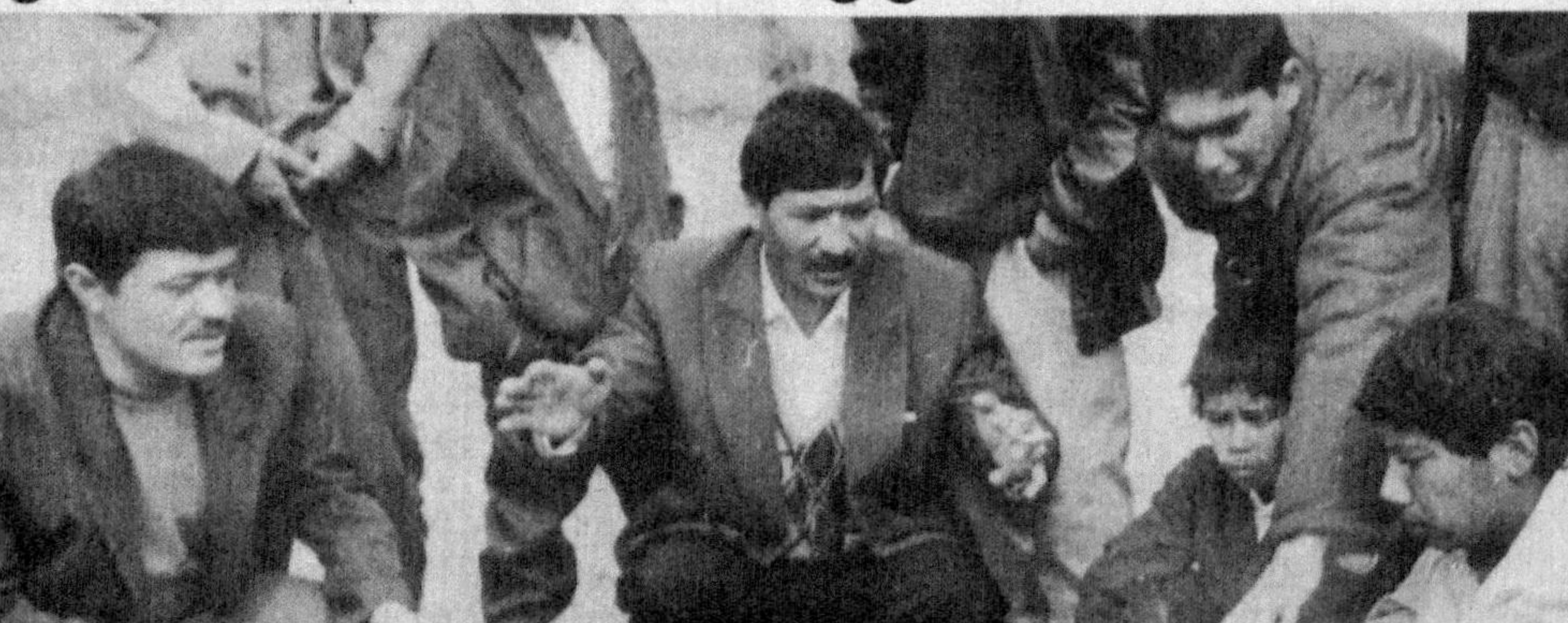
Ким зўр чиқарган?