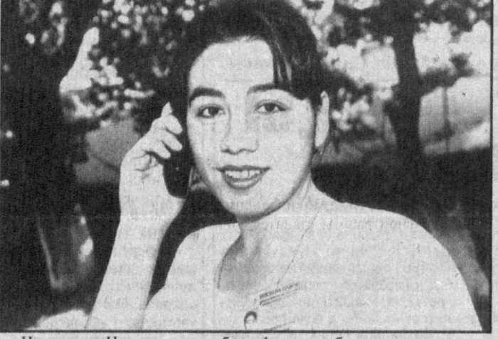
Недавно в Навои начал работу филиал узбекско-американского предприятия...

Презентация «Coscom» в Навоийской области проводилась во дворце культуры «Фархад».