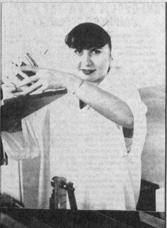
Узбек-чешскому совместному предприятию «Лечива-Фармсановат» в городе Гулистане исполняется три года. Это СП выпускает лекарственные препараты, поступающие в аптеки республики, а также государства Средней Азии.

Сейчас предприятие выпускает 22 вида лекарственных препаратов, к концу года их производство будет увеличено до 35 наименований.