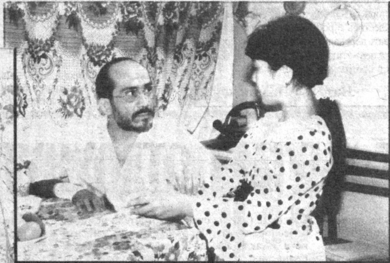
кинофестиваля «За лучший сложно-постановочный фильм».

Дастан «Алпомыш» - это легенда о любви и мужестве, коварстве зла и победе сил добра. Это то, что всегда манит людей к извечным истинам бытия.