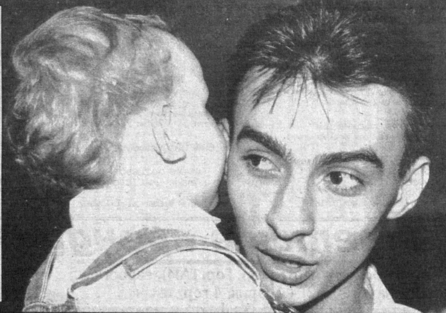
У мужчин свои секреты.