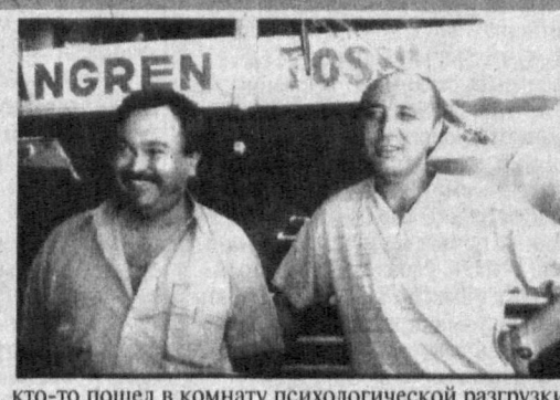
кто-то пошел в комнату психологической разгрузки, кто-то - в сауну, другим интересно доиграть отложенную накануне шахматную партию.

После работы здесь не сразу торопятся домой: