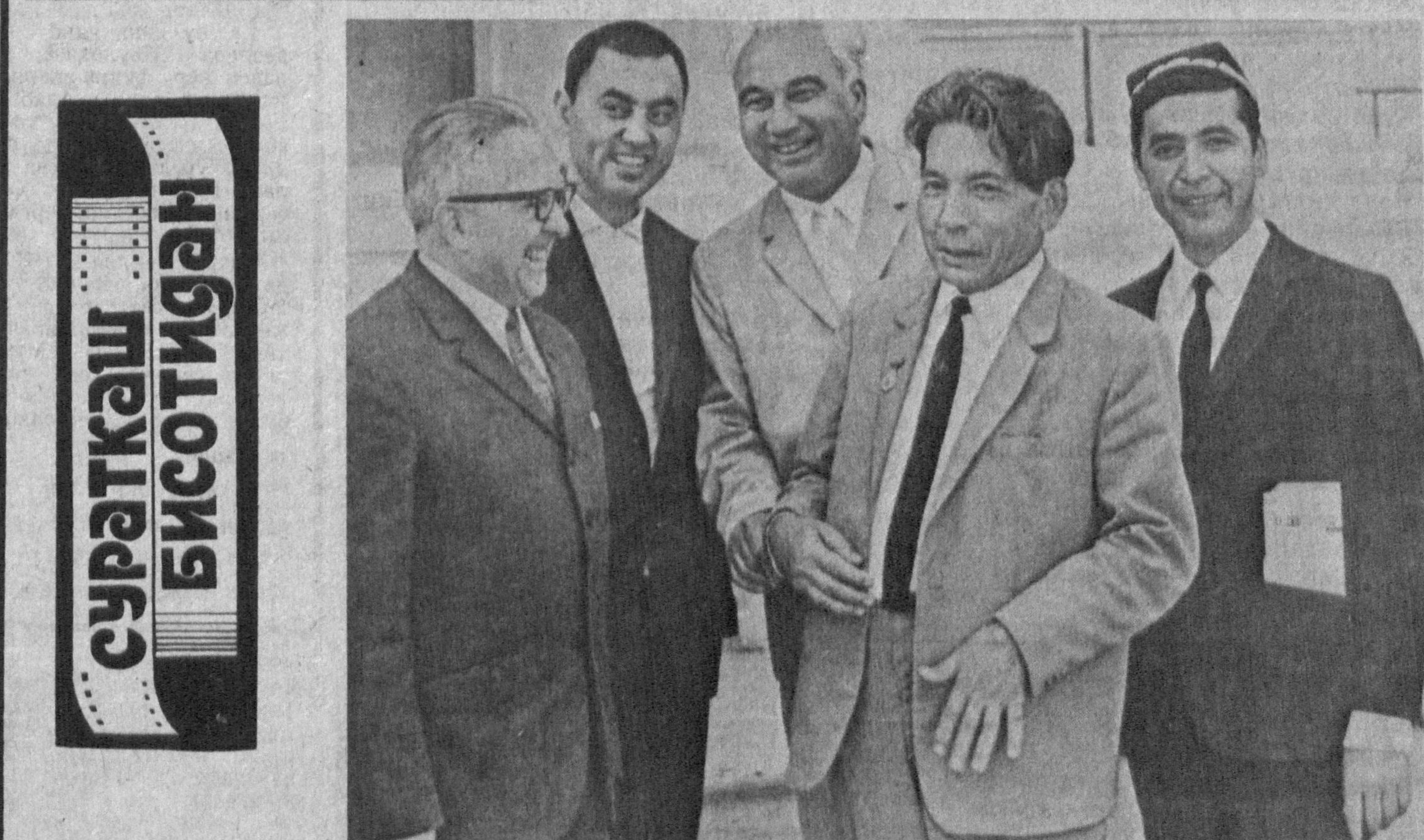
Суратда: актёрлар — Олим Хўжаев, Тўлқин Тожиев...