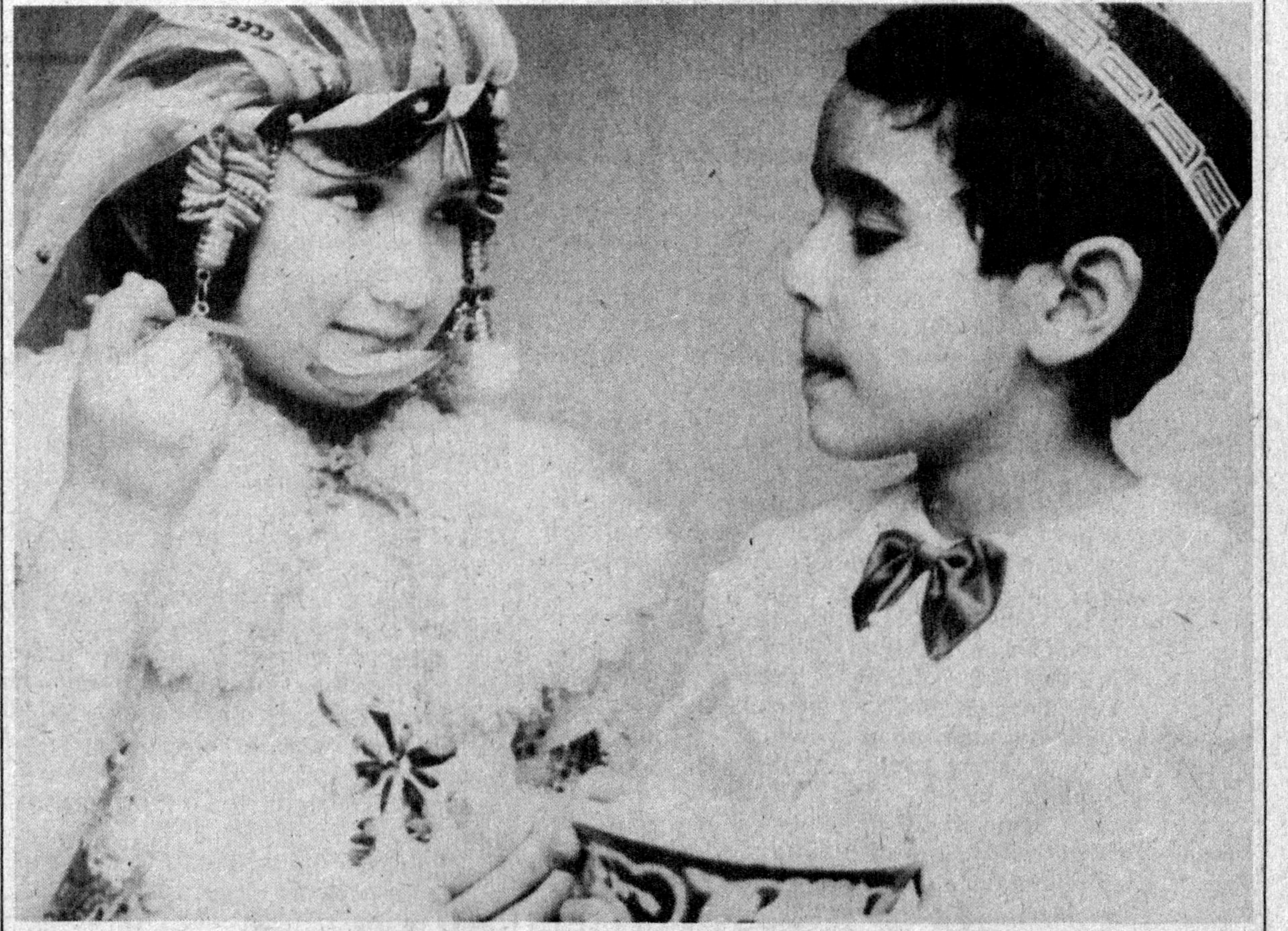
—Сумалакми?! Менга ҳам қолдир...