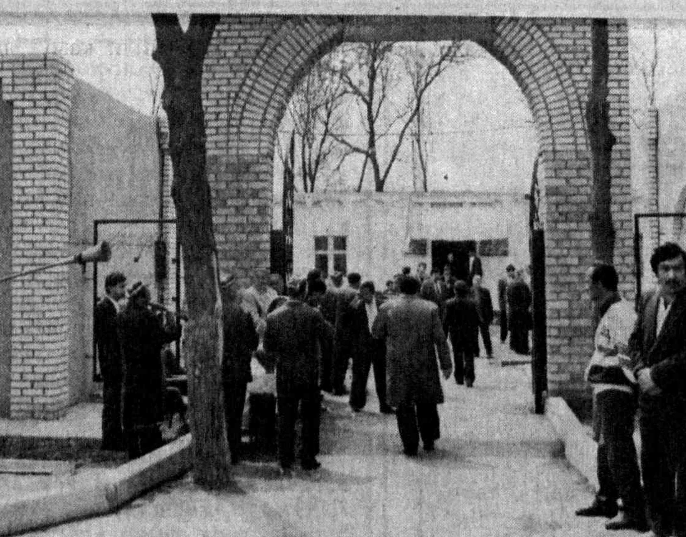
Барча қулайликларга эга булган гузарга маҳалла кўмитаси, бозор расаталари, аҳолига хизмат кўрсатиш шахобчалари, дўконлар, чойхона, Халқ банки бўлими фаолият кўрсатди.