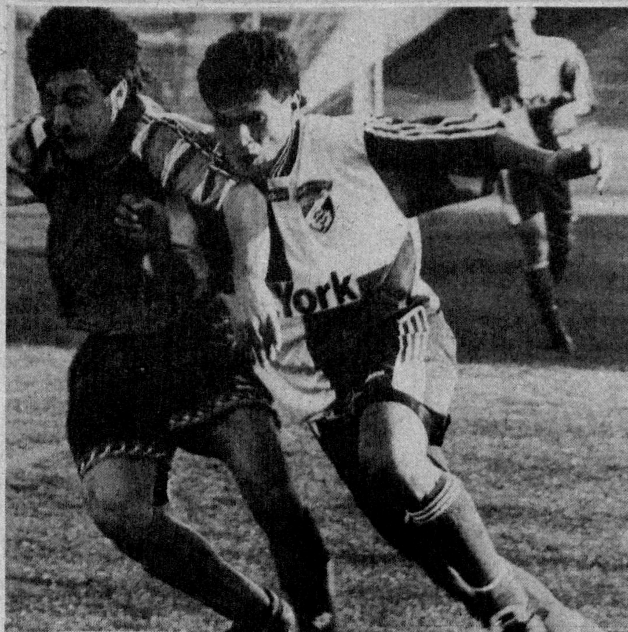
Қулар қизгани сайи майдонларда ўйинлар ҳам қизиқ, учрашувлар эса борган сари кутимлаган натижаларга бой бўлиб бормоқда.

Ўтган турда Кўқонда "Темирйўлчи" дарвозасига 6 та жавобсиз тўп йўллаган "Андижон" жамоаси бу сафар ҳам шов-шув кўтарди. Тошкентда бўлиб ўтган "Пахтакор" -- "Андижон" учрашувида ҳам 6 та тўп киритилди, бироқ... 5 таси меҳмонлар дарвозасига. Ўз сафида миллий терма жамоасининг қарийб ярим аъзосини жамлаган "Пахтакор" уйиндан ўйинга очилиб, мухлисларни қўвонтириб келмоқда. Ҳар йили ҳам шундай бўлади -- мажкур жамоа чемпионатнинг бошларида "унча-мунча" сизга ён бермай туради-да, кейин-кейин эса фақат номдор ва пешқадам жамоаларга қарши кескин курашади, мундайроқларига эса очко улашиб бораверади.