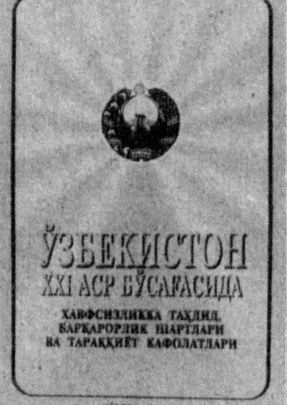
ЎЗБЕКИСТОН XXI АСР БЎСАҒАСИДА ХАВФСИЗЛИККА ТАҲДИД, БАРҚАРОРЛИК ВА ТАРАҚҚИЁТ КАФАЛАТЛАРИ

Афсуски, инсоният тарихида диний онгининг ажратмас қисми бўлган одамларга эътиқоддан фақат бунёдкор куч сифатида эмас, балки айрон қилувчи куч, ҳатто фанатизм (ўта кетган мутассабихлик) сифатида фойдаланилганини кўрсатуви мисоллар кўп. Фанатизмнинг ўзига хос хусусияти ва кўринишлари авваломбор ўз динининг ҳақиқийлигига ўта қаттиқ ишонич, бошқа диний эътиқодларга муроасиз муносабатда бўлишдан иборатдир.