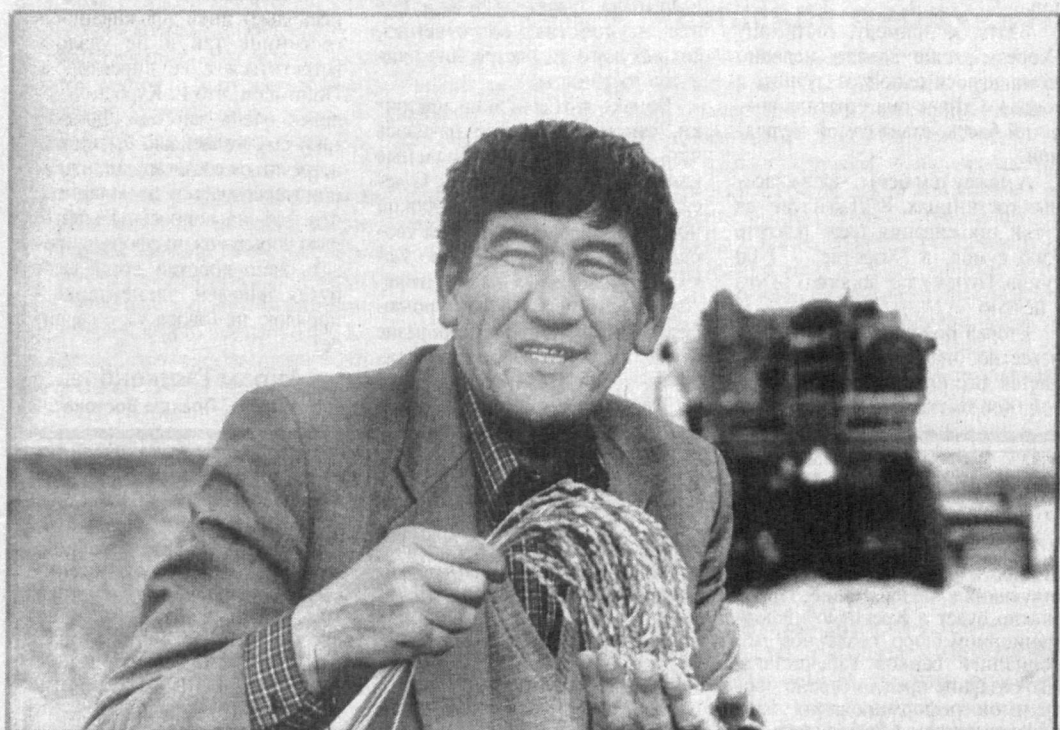
Земледельцы ширкатного объединения "Шоликор" Сырдарьинского района обязались в нынешнем году сдать государству 5345 тонн шалы. Урожай выращен нынче на славу. В эти дни идет съем урожая "Кейсами" и российскими комбайнами.