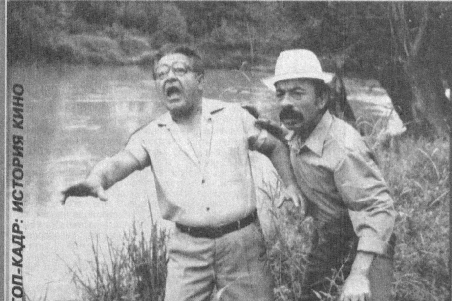
СТОП-КАДР: ИСТОРИЯ КИНО