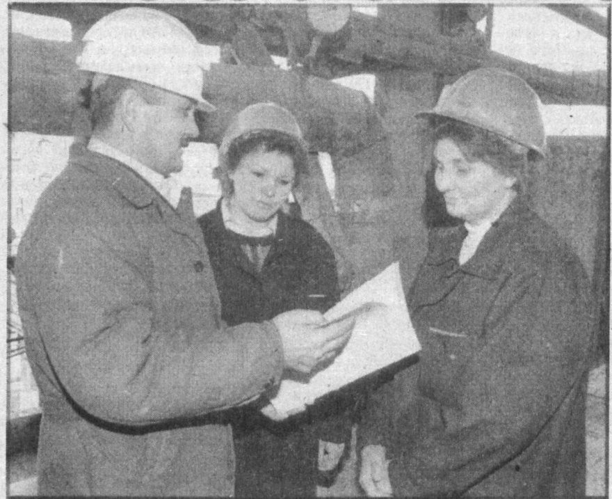
Аммофоское производственное объединение «Аммофос» является самым крупным из трех предприятий, производящих фосфорные удобрения. Здесь изготавливается семидесять процентов порошковых минеральных веществ, используемых для потребности нашей страны.