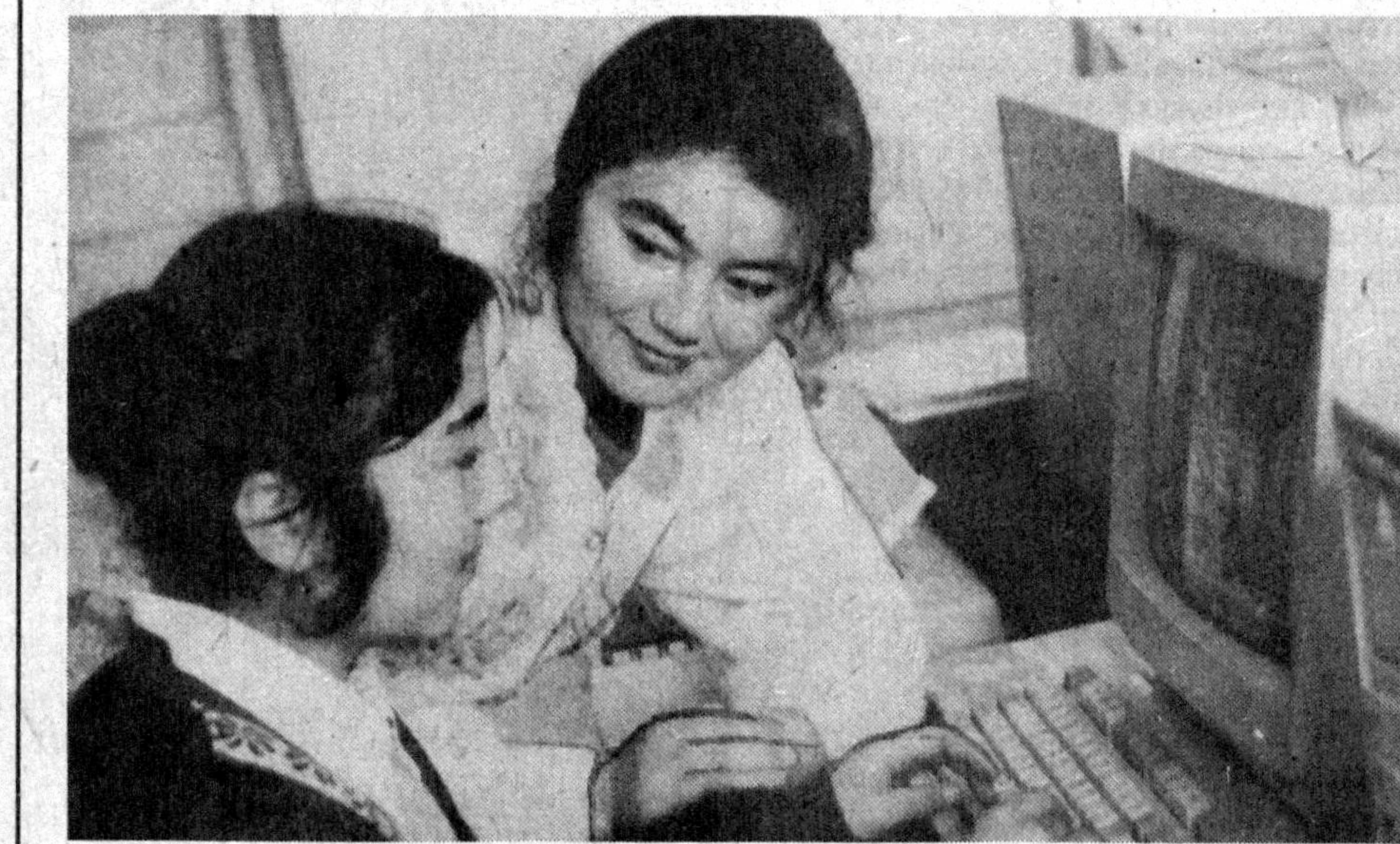
Компьютер сирларини ўзлаштирадик, марра бизники!